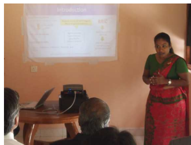
ワヤンバ大学研究生による研究発表