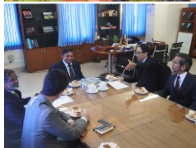
ワヤンバ大学エカナヤケ学長との面談